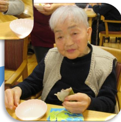
おいしさにうっとり