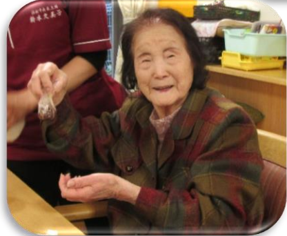
ラップに包んで あんこ玉を作ります。