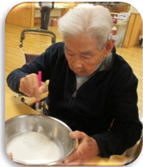
材料をよく混ぜます。